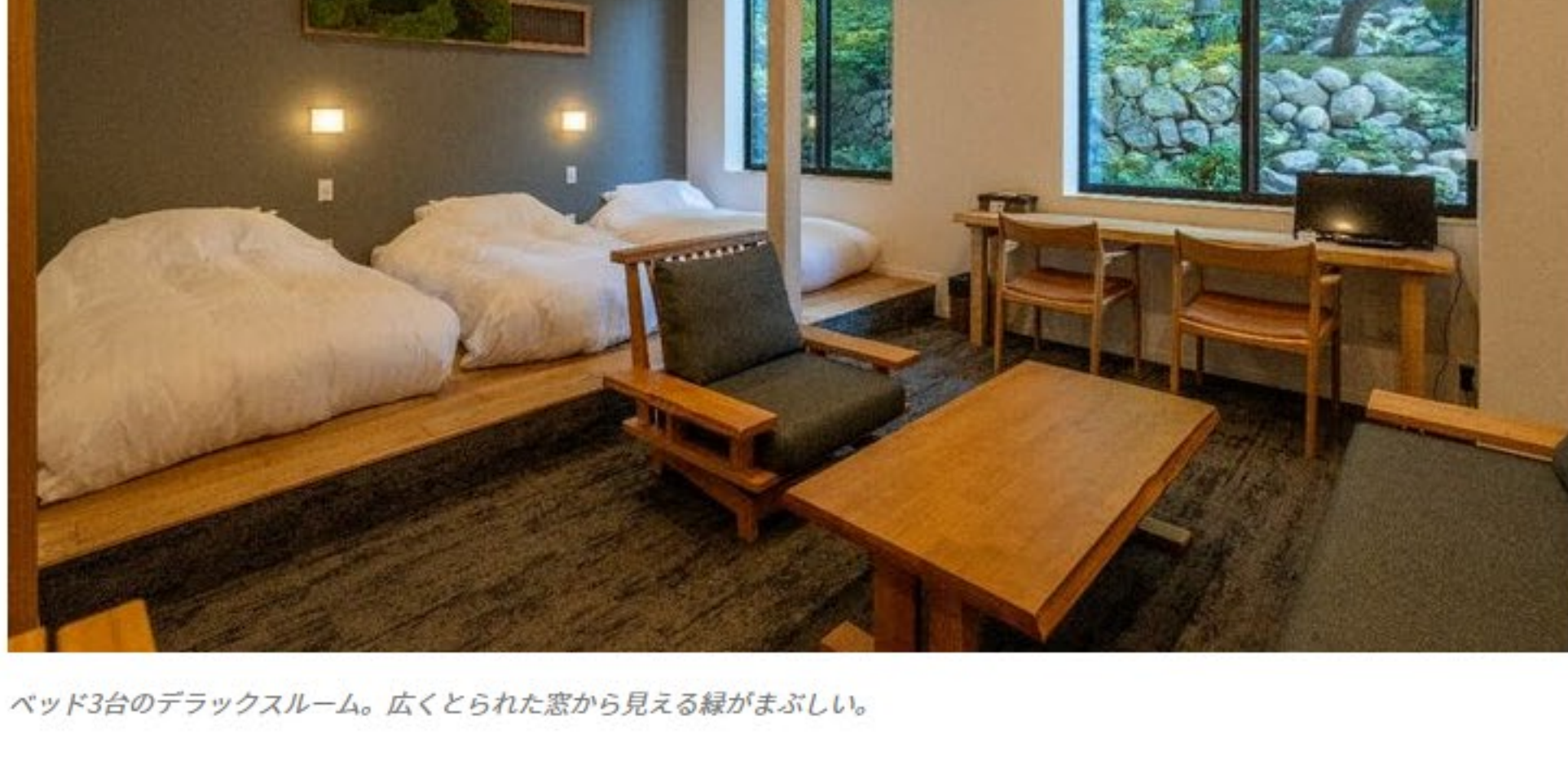
ベッド3台のデラックスルーム。広くとられた窓から見える緑がまぶしい。

客室はホテルタイプのツインルームから、グランピングルームまで多彩なラインナップ。窓の外に石原氏プロデュースの庭園が広がるも非日常空間は、心身に安らぎを与えてくれるはず。