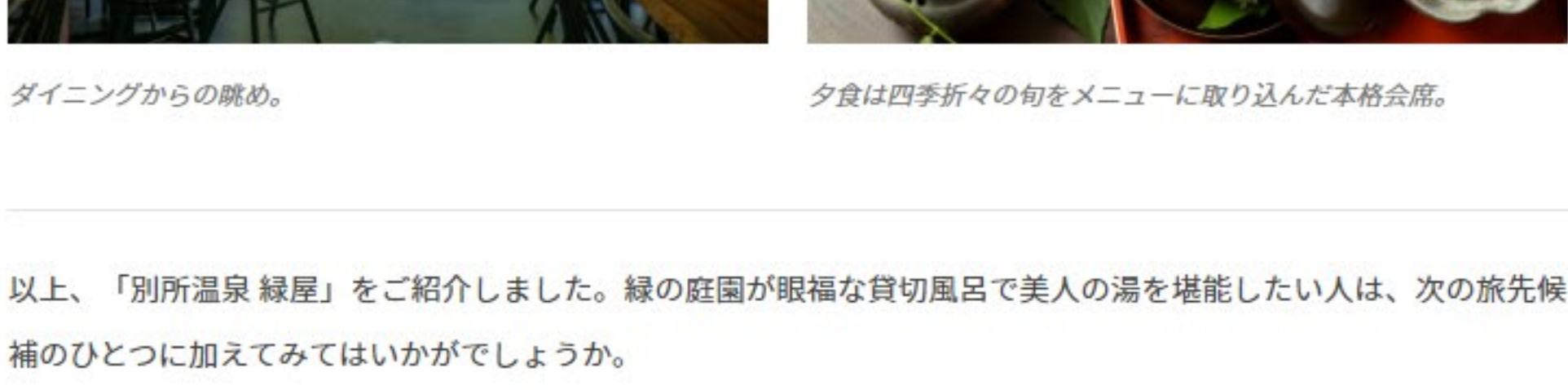
夕食は四季折々の旬をメニューに取り込んだ本格会席。

以上、「別所温泉 緑屋」をご紹介しました。緑の庭園が眼福な貸切風呂で美人の湯を堪能したい人は、次の旅先候補のひとつに加えてみてはいかがでしょうか。