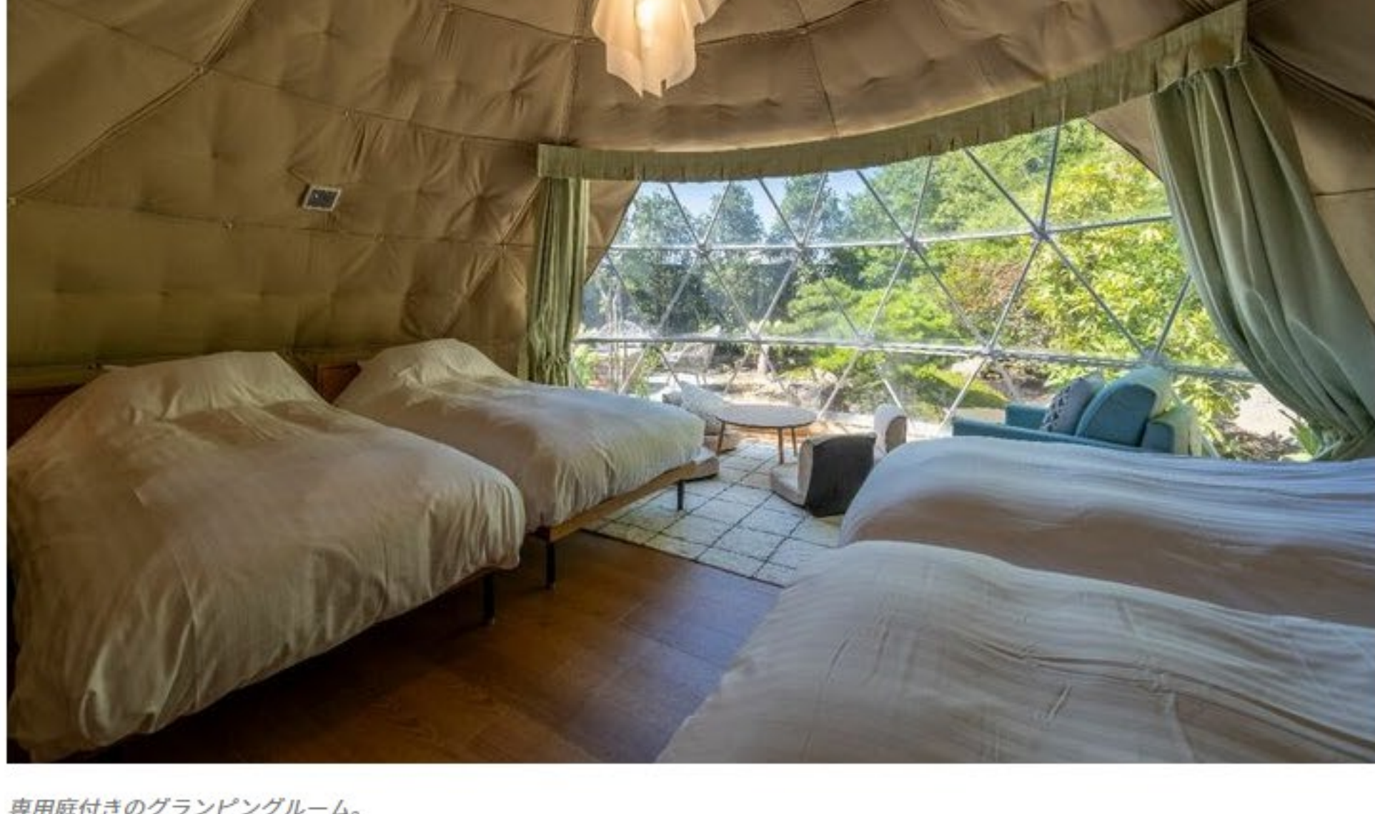
専用庭付きのグランピングルーム。

「自然豊かな環境でありつつ、最先端の『モバイルコンシェルジュ』を採用しているのも興味深いです。『モバイルコンシェルジュ』とは、チェックイン、チェックアウトの手続き、夕食時のドリンクの注文、貸切風呂の空き状況のチェックなどをスマホ一台でできるサービス。ビジネスホテルでは増えつつありますが、温泉宿としてはまだまだ珍しいシステムをいち早く取り入れているのは画期的だと思います」（植竹さん）