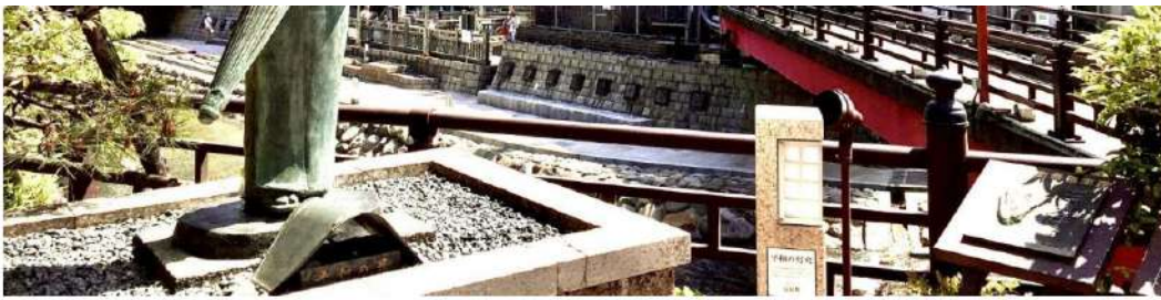
「夢千代の像」と湯村温泉

実際ポテンシャルはあり、若い方が地元に戻り商店や飲食店を立ち上げ、お湯の泉質もいいので陣屋がお役に立てればいいですね。