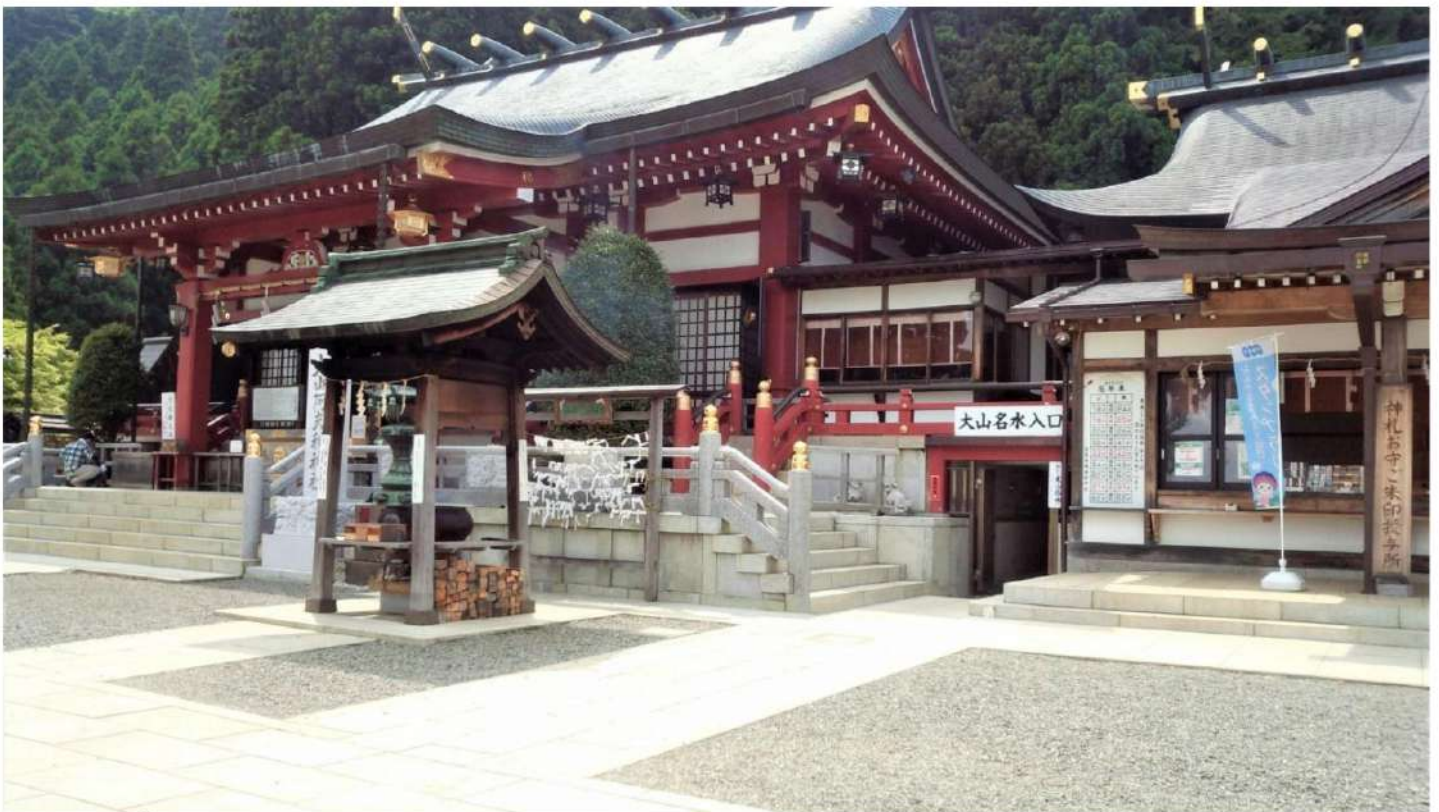
車で20分のところに大山阿夫利神社がある。