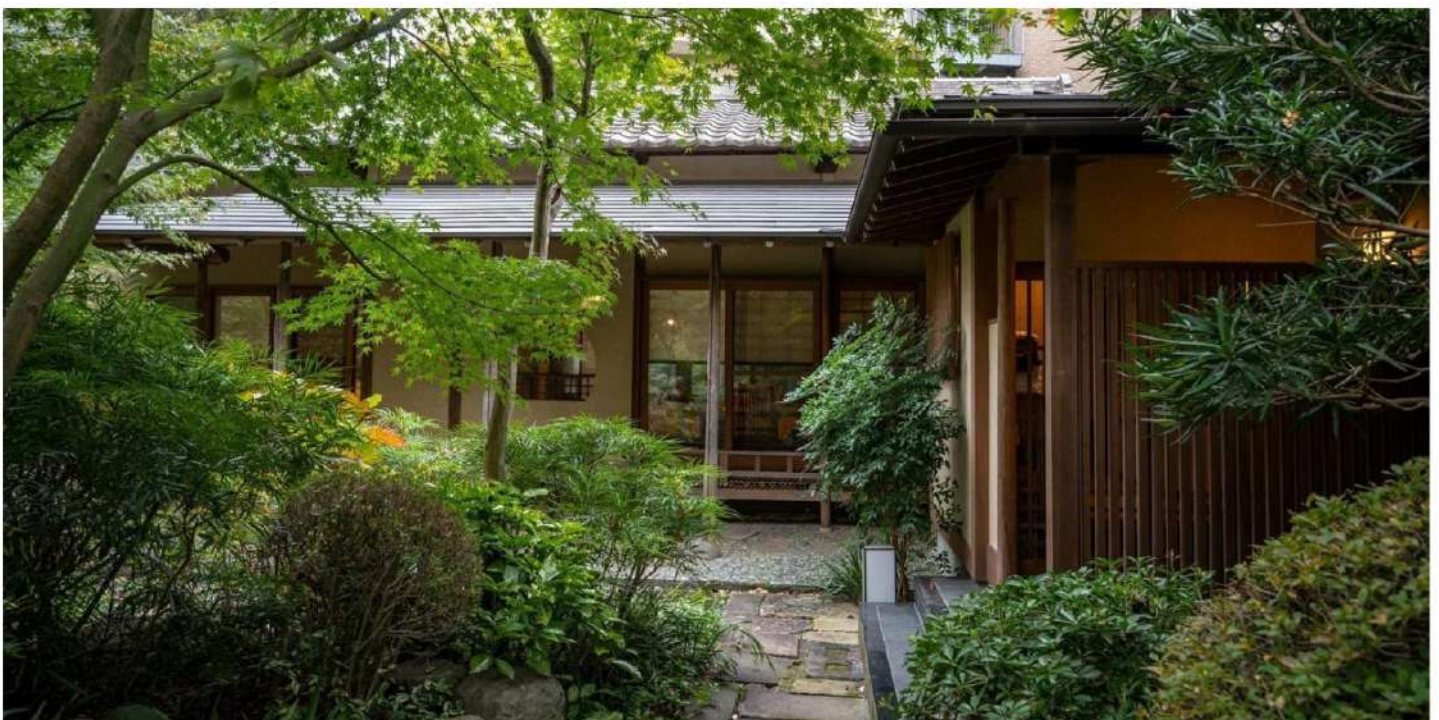
離れ貴賓室「狩鞍庵」