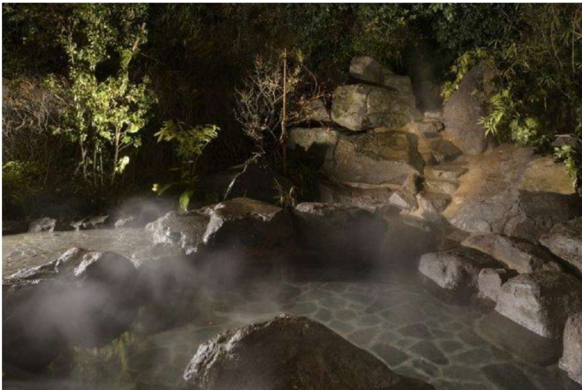
山荘露天風呂「山桜」

——そこで3年で経営を立て直された素晴らしい手腕が大きな反響を呼んでいます。そういう中で、旅館は日本の地方創生にとって大切と考えますが、いかがでしょうか。