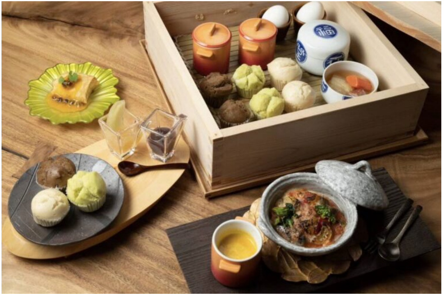
写真：洋風メニューの一例。手作り源泉蒸しパンは100%米粉を使用したグルテンフリー。野菜のスープや野菜蒸しなどヘルシーです