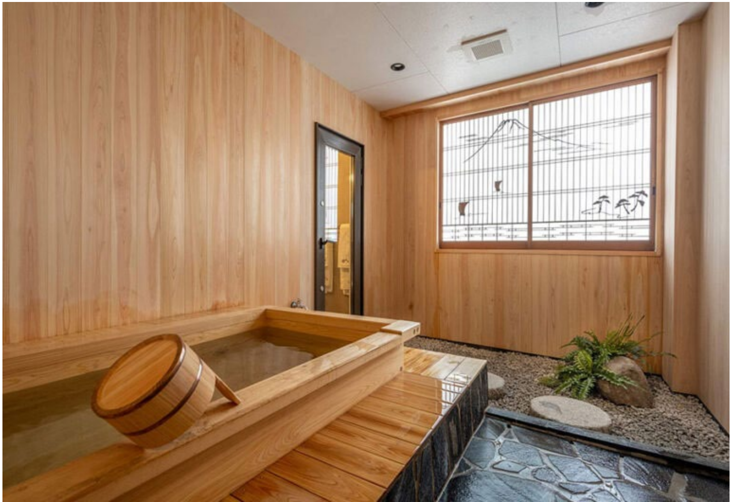
写真：プレミアムルームの総檜風呂