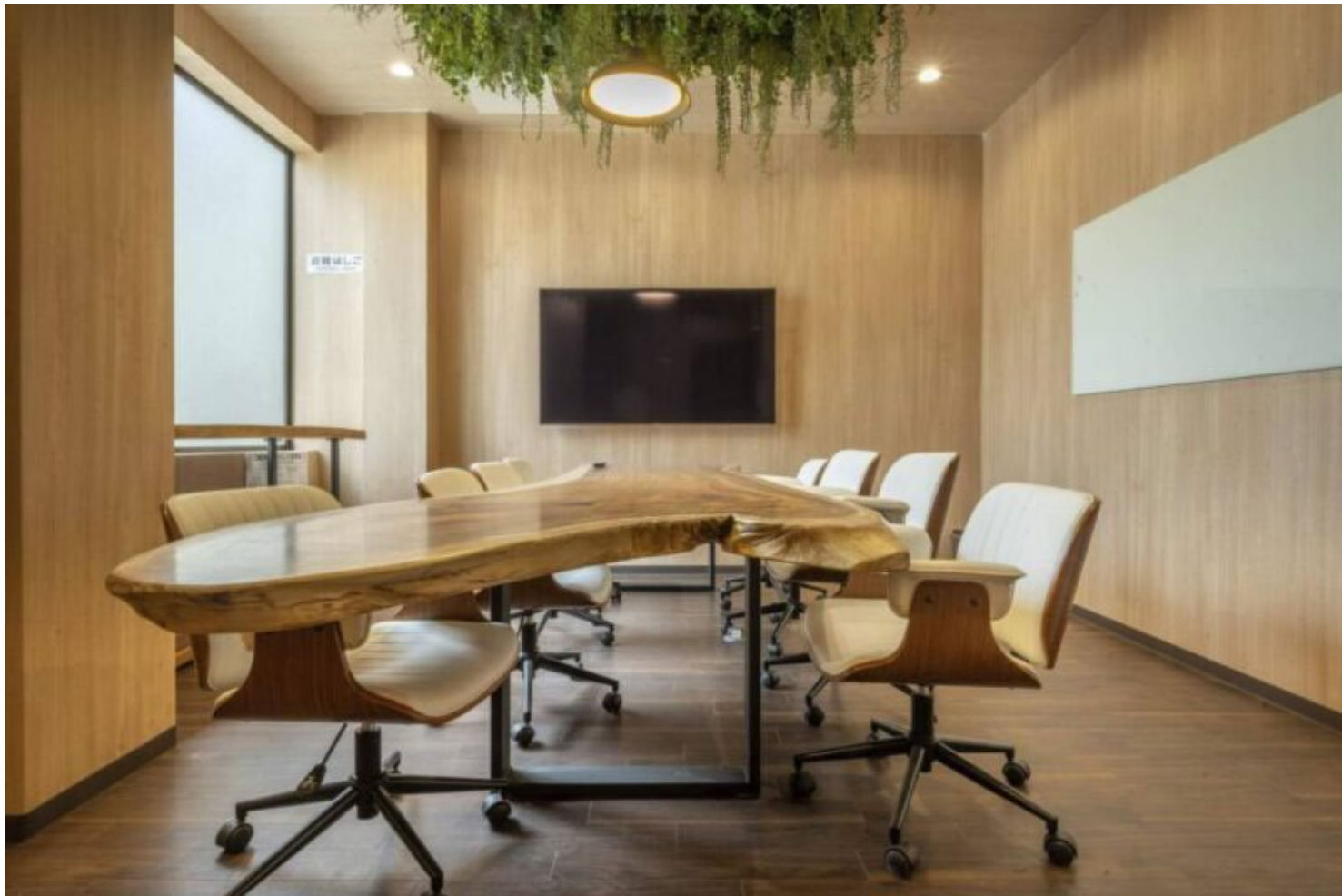
写真：木や緑などに囲まれた会議室。仕事がはかどりそうですね