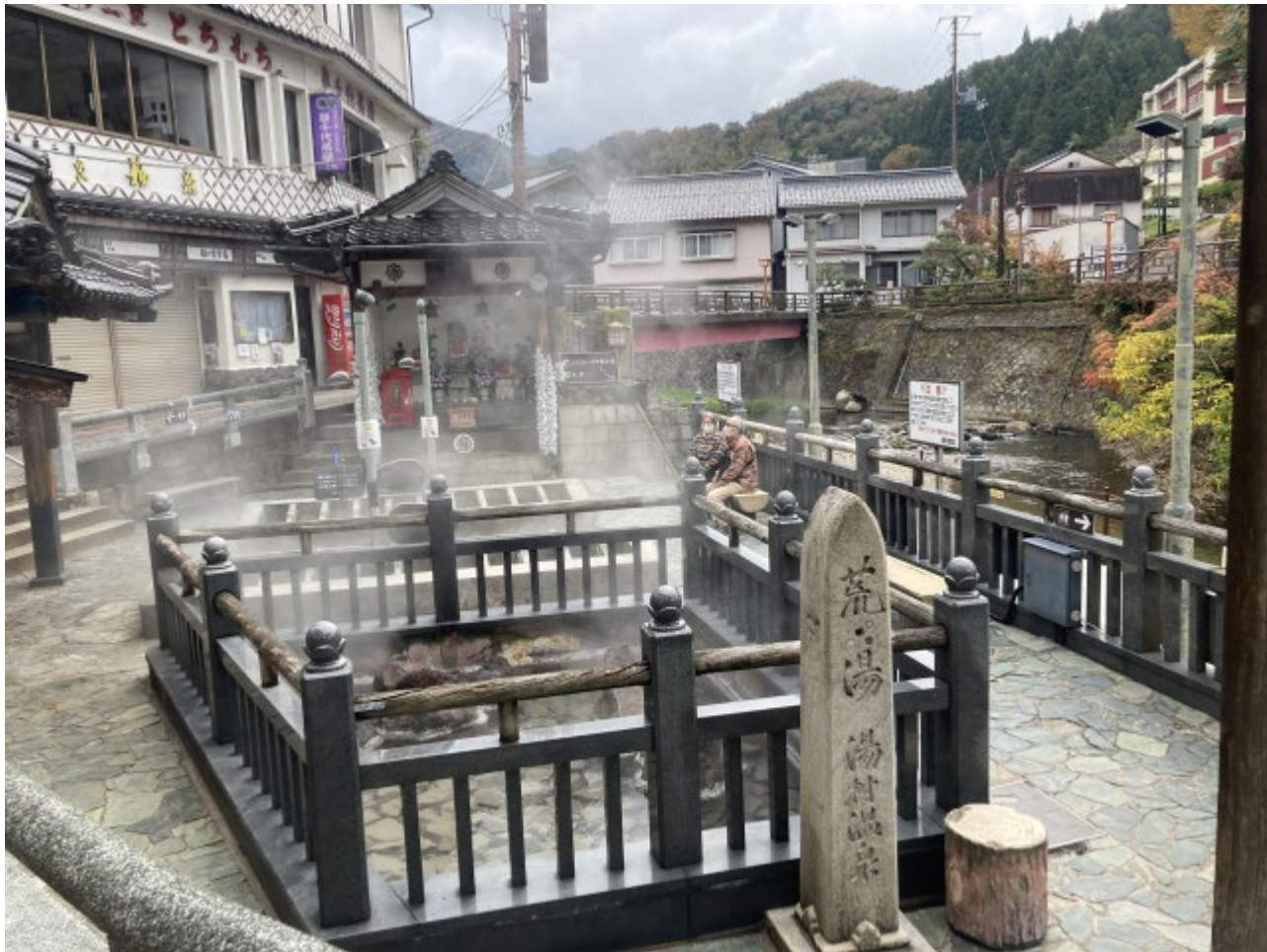
写真：湯気がもうもうと立っている荒湯では、温泉卵を茹でる観光客も多い

深いボーリングを必要とせず数メートルの深度で湧出しており、需要量に比べて湧出量の豊富な温泉のため、旅館だけでなく各家庭にも配湯され、湯村の生活に欠かせないものとなっています。