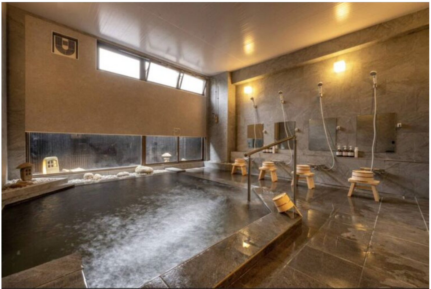
写真：大浴場（風の湯）