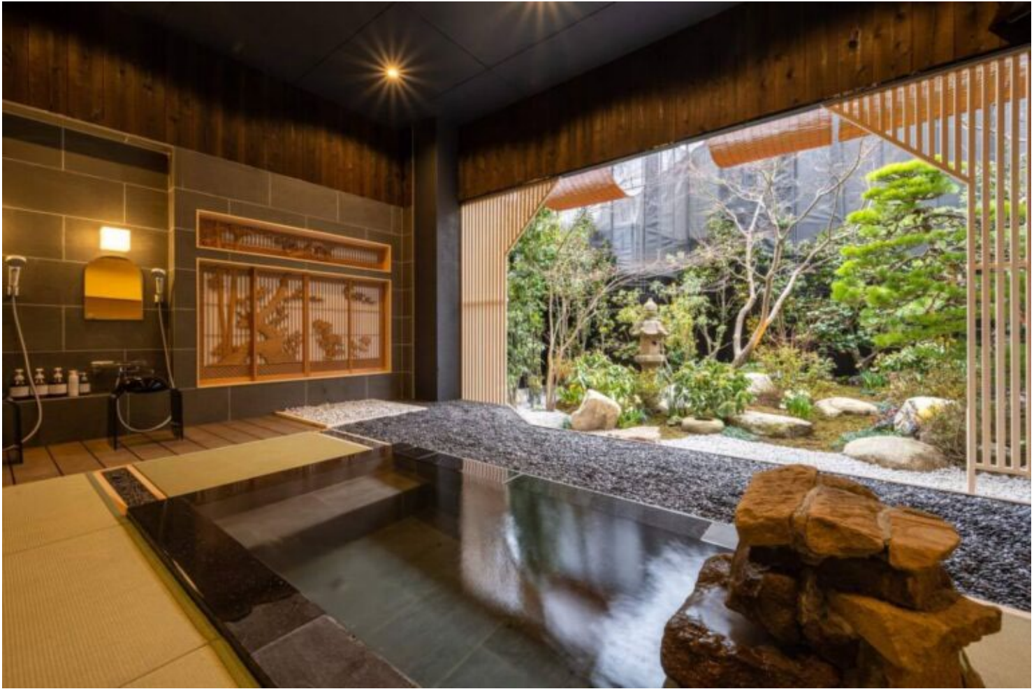
写真：庭園付貸切露天風呂風呂