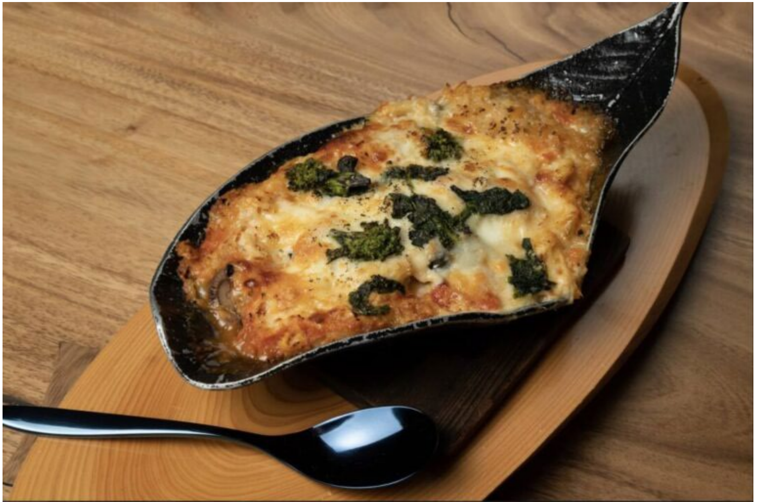
写真：単品メニューの蟹ドリア