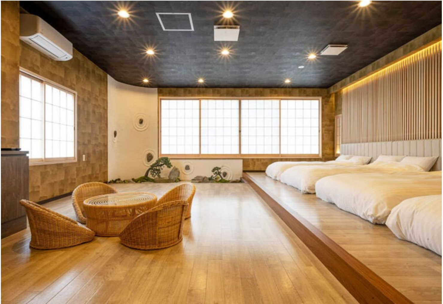
写真：広々としたファミリールーム